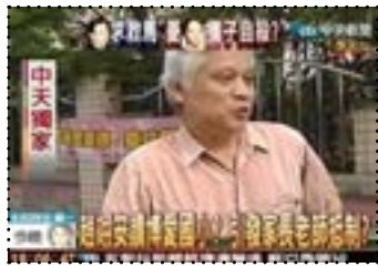
• 以兒童青少年為報導關係人

兒少新聞又可以依報導性質區分成「正面新聞」與「負面新聞」，正面新聞包含兒少的成就、貢獻或孝悌楷模，以及兒少議題的報導，例如：教育、休閒娛樂、健康、安全、次文化、社會參與等。負面新聞則指涉及兒童少年相關法規之個案，例如：遭受虐待、遺棄、性侵、中輟、暴力、死亡及學業問題等報導。