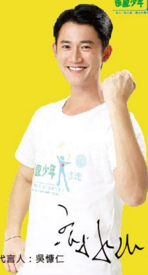
逆風公益代言人：吳慷仁