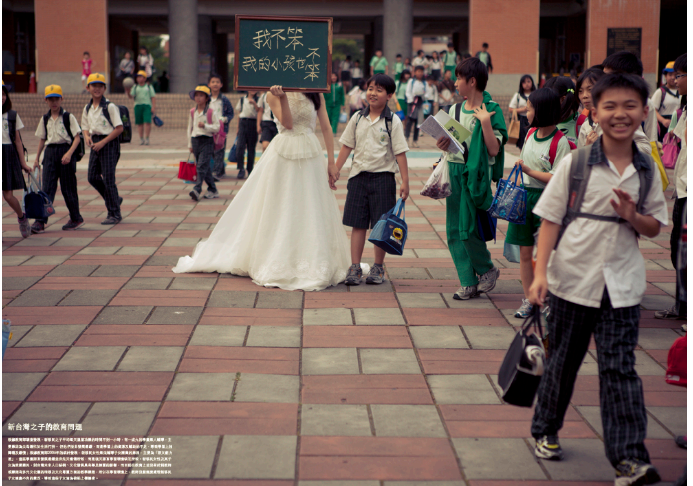
新台灣之子的教育問題

根據教育部調查發現，新移民之子平均每天溫習功課的時間不到一小時，有一成九的學生無人輔導，主要原因是父母親忙於生活打拚，但他們並非發展遲緩，而是學習上的資源及輔助不足，導致學習障礙；另一方面也有父母本身「語文能力較差」的問題。這些新移民家長應尋求政府協助，提高其語言學習環境及水平，確保其子女之文化適應。政府應加強對新移民之文化適應及子女輔導之協助，所以在新移民教育上，政府應加強與新移民子女溝通之協助，確保這些子女能為貼上標籤。